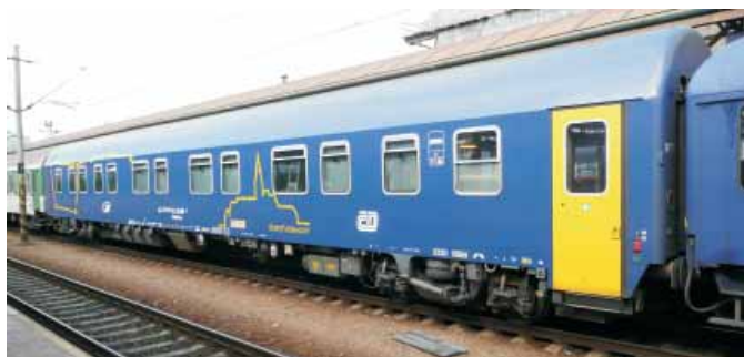
35512 new SOSE 05-2009 CD Schlafwagen WLABmz 173.1. Epoche V. Betriebsnummer 61 54 72-91 003- 8 „Holasovice“.