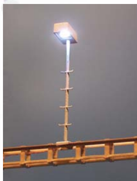
Art. 7250 moderne Gleislampe für Querträger (Produktion bei genügender Nachfrage)